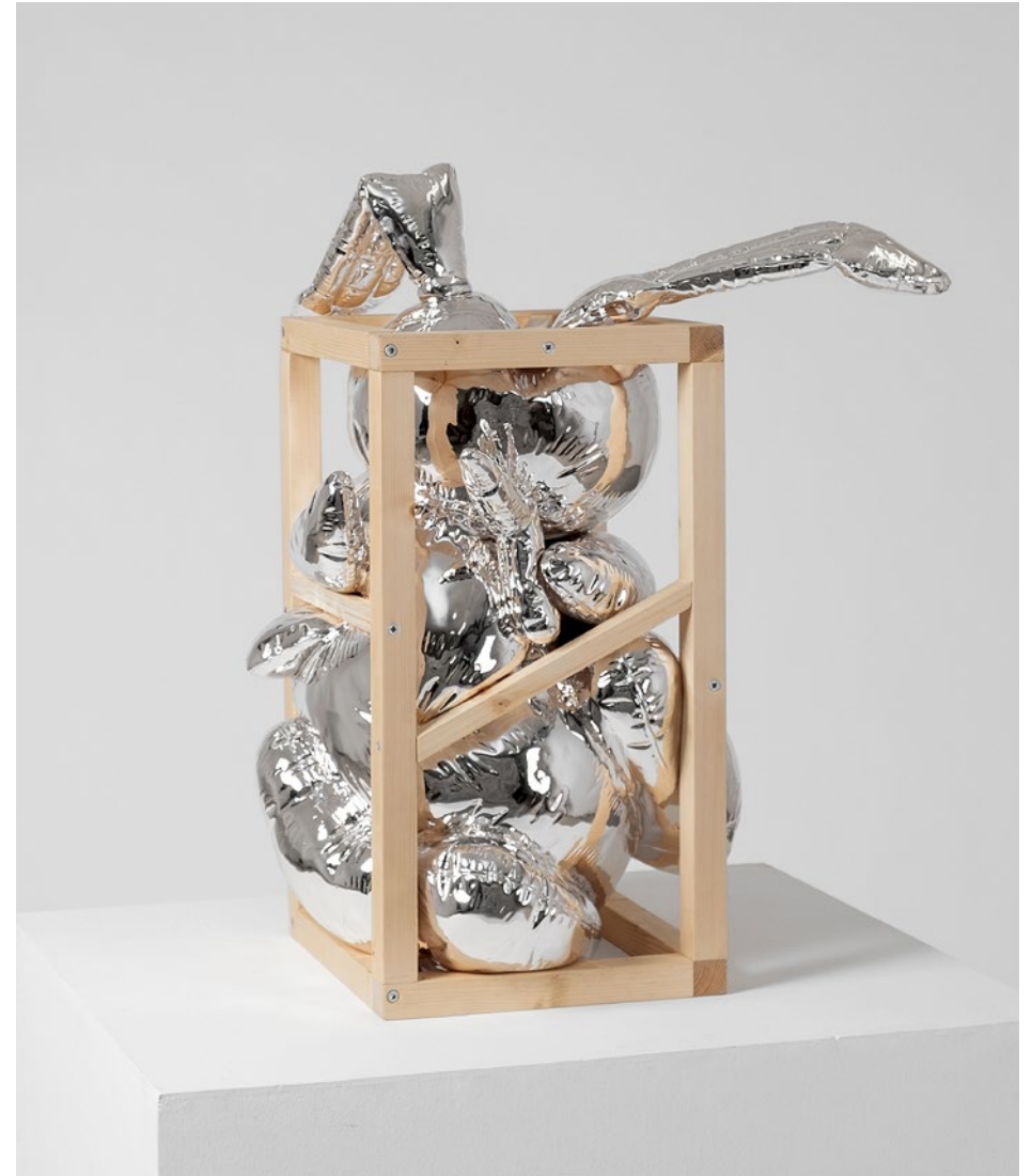
Cage n°11 - Rabbit 45x40x65 cm Jesmonite, placcatura cromata in argento, legno, 2022