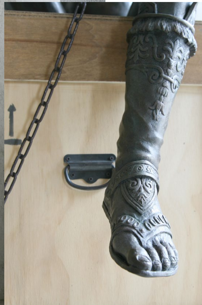
Box n° 4 – David di Donatello 50x60x150 cm Jesmonite, ossidi metallici, legno, 2017