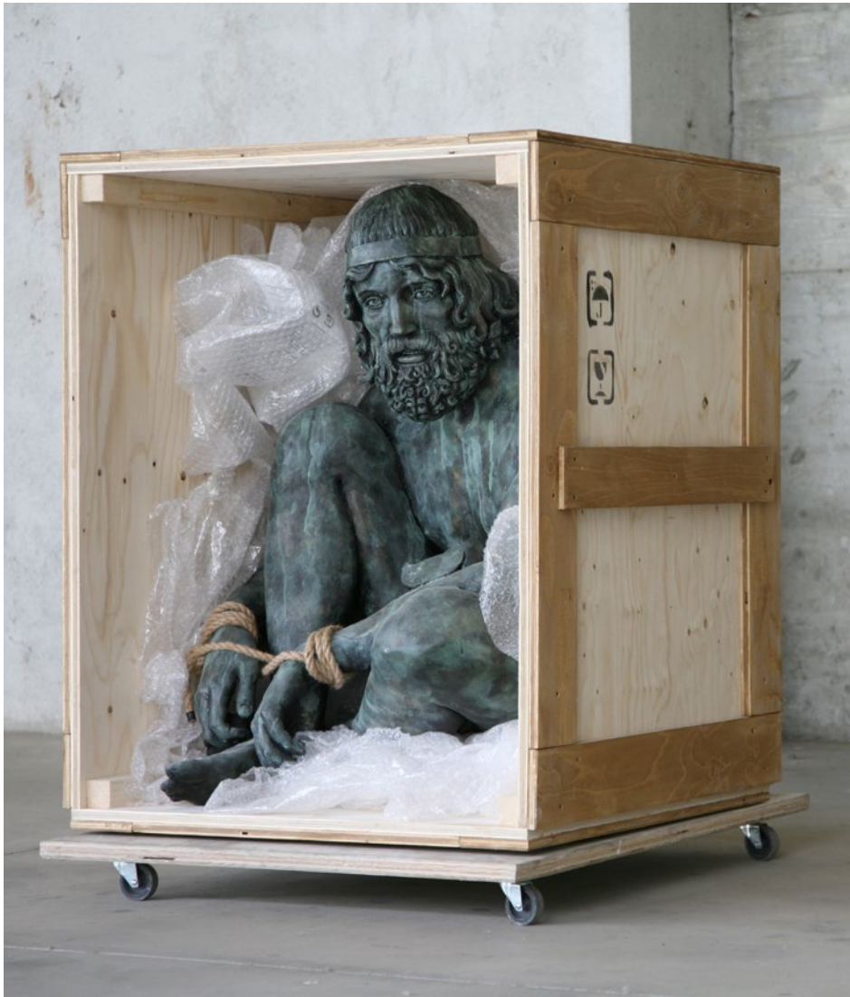
Box n° 2 – Bronzo di Riace 75x80x90 cm Jesmonite, legno, corda, pluriball, ossidi metallici, 2016