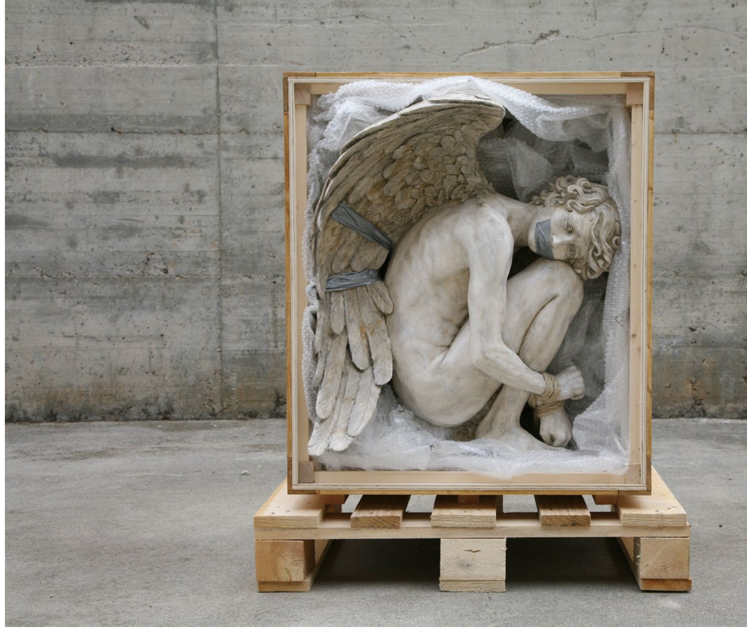
Box n.7 Amore rapito 60x45x80 cm Jesmonite, legno, corda, pluriball, 2022