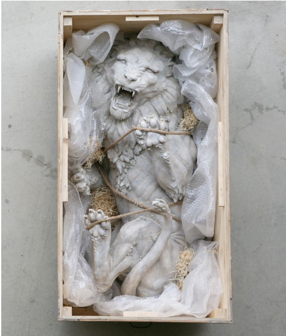
Box n.5 Leone Nemeo 75x140x65 cm Jesmonite, legno, corda, pluriball, 2017