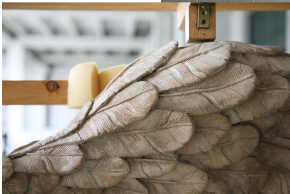
Cage n° 1 – Ala Nike di Samotracia 85x30x150 cm Jesmonite, legno, 2017