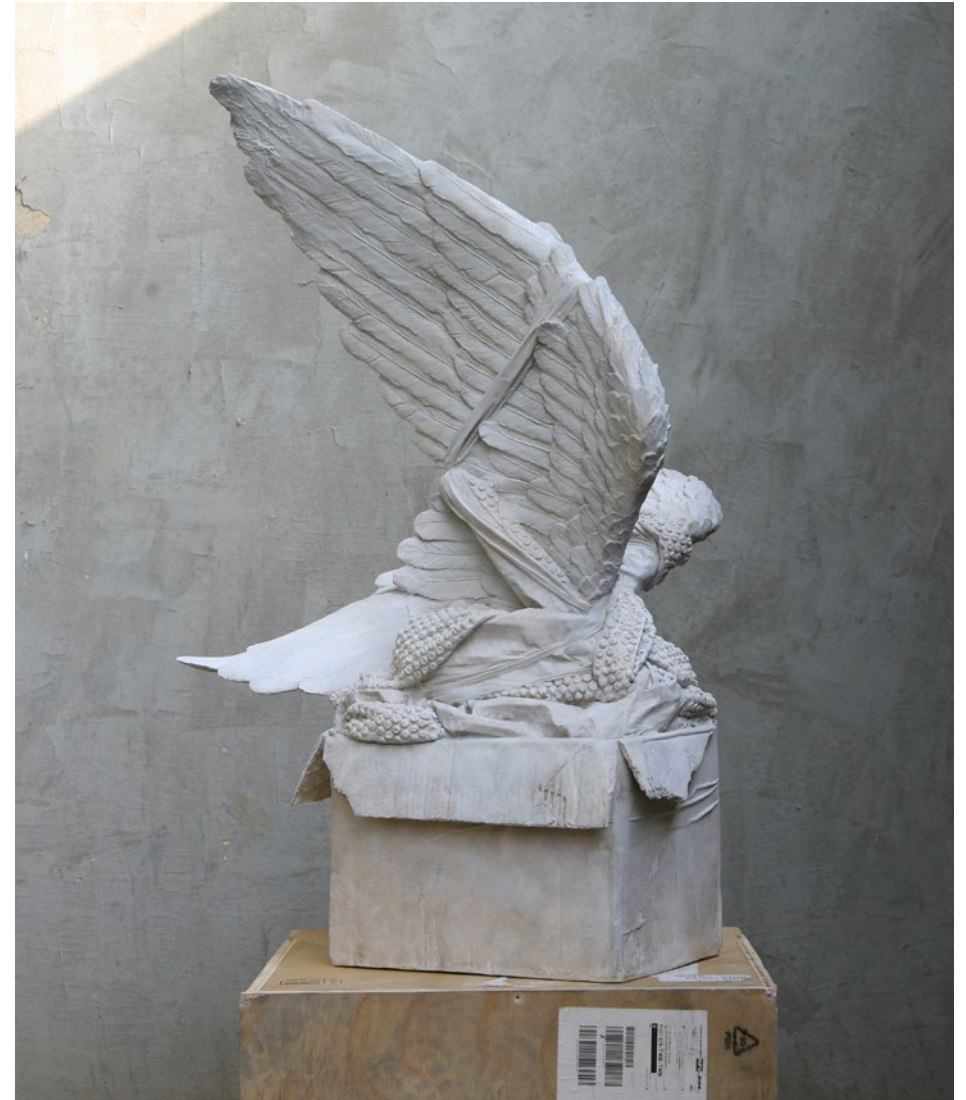
Wrapped n° 5 – Amore Rapito 50x70x100 cm Jesmonite, 2023