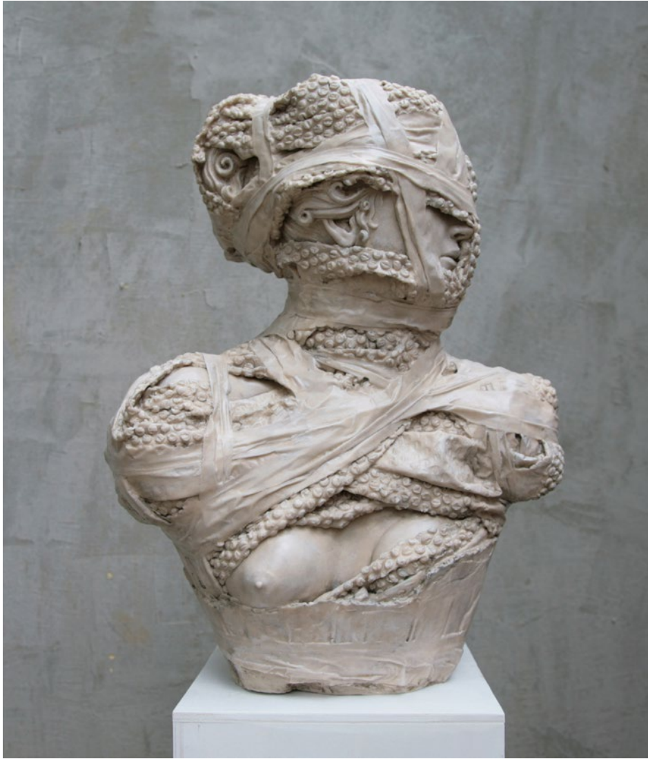
Wrapped n° 3 – Venere 45x35x60 cm Jesmonite, 2022