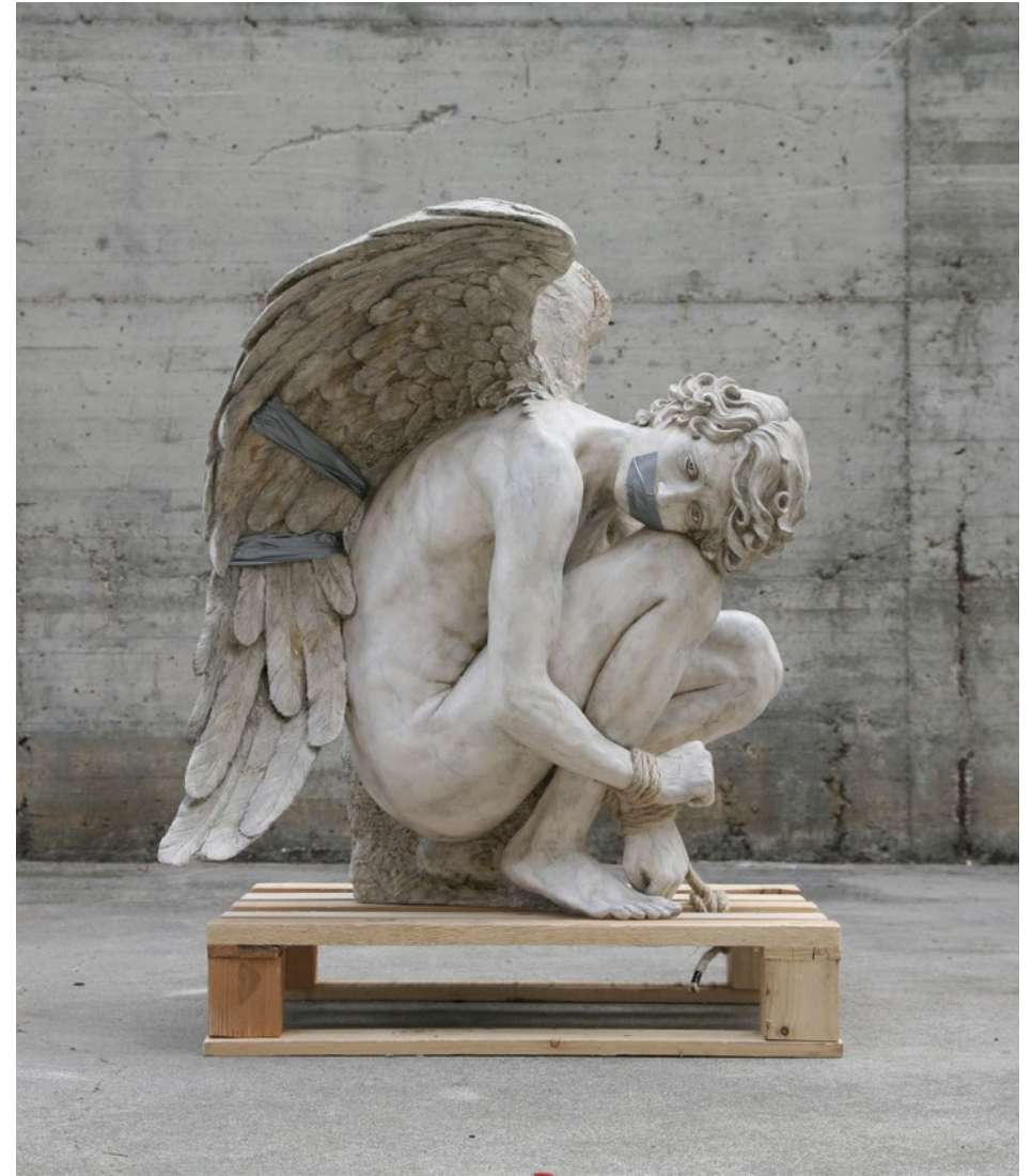
Pallet n° 1 - Amore rapito 60x45x80 cm Jesmonite, legno, corda, nastro adesivo, ossidi metallici, 2022