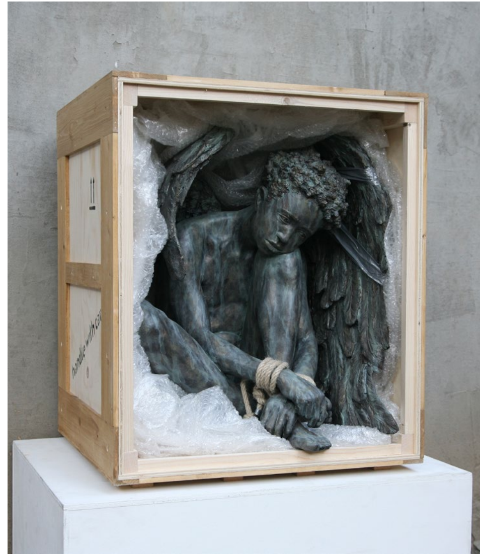
Pallet n° 4 30x25x40 cm Jesmonite, legno, spago, ossidi metallici, 2022