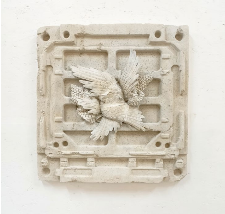
Wrapped n° 6 65x65x12 cm Jesmonite, 2025