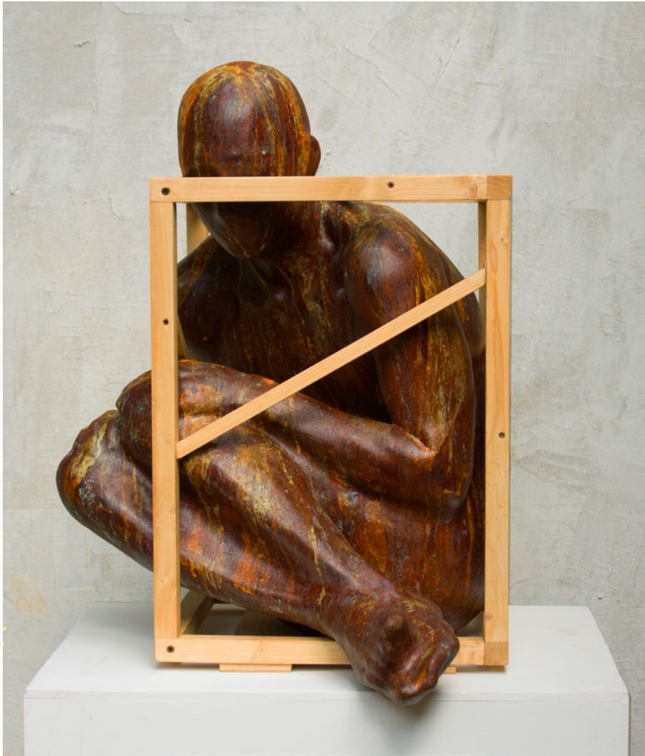
Cage n° 12 57x63x75 cm Jesmonite, legno, ossidi metallici, 2021