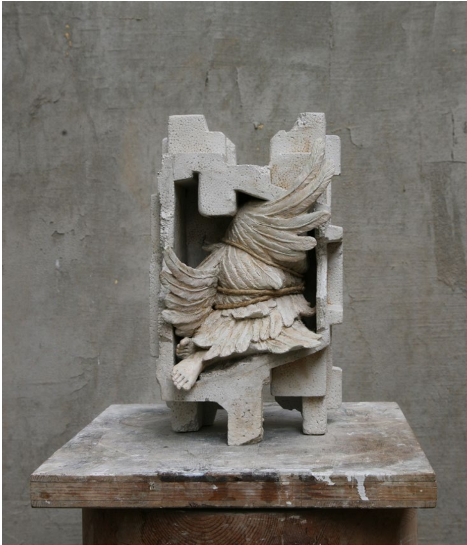
Wrapped n° 4 32x21x20 cm Jesmonite, spago, 2024