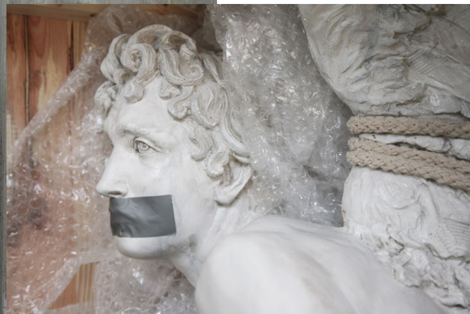
Box n° 1 – Amore rapito 60x45x80 cm Jesmonite, legno, corda, pluriball, 2015