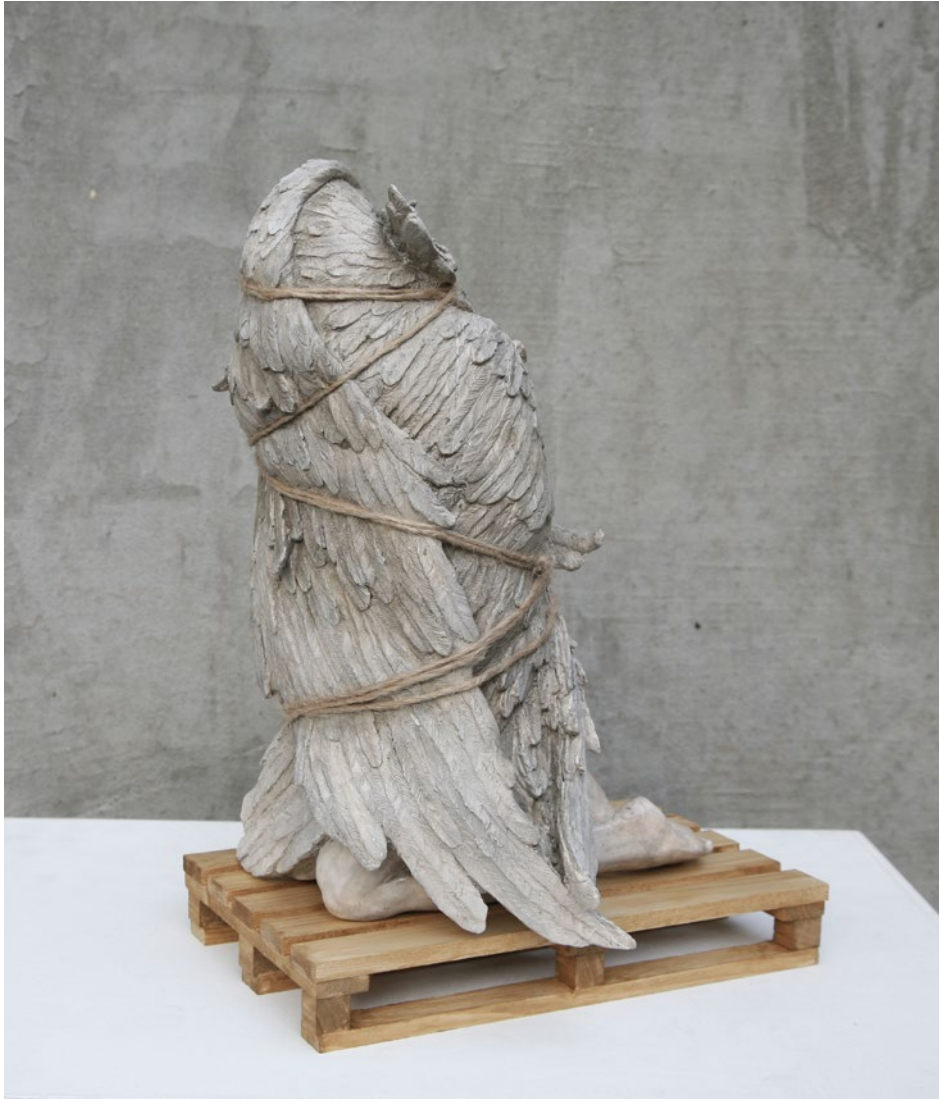
Wrapped n° 2 30x20x40 cm Jesmonite, legno, spago, ossidi metallicci, 2022